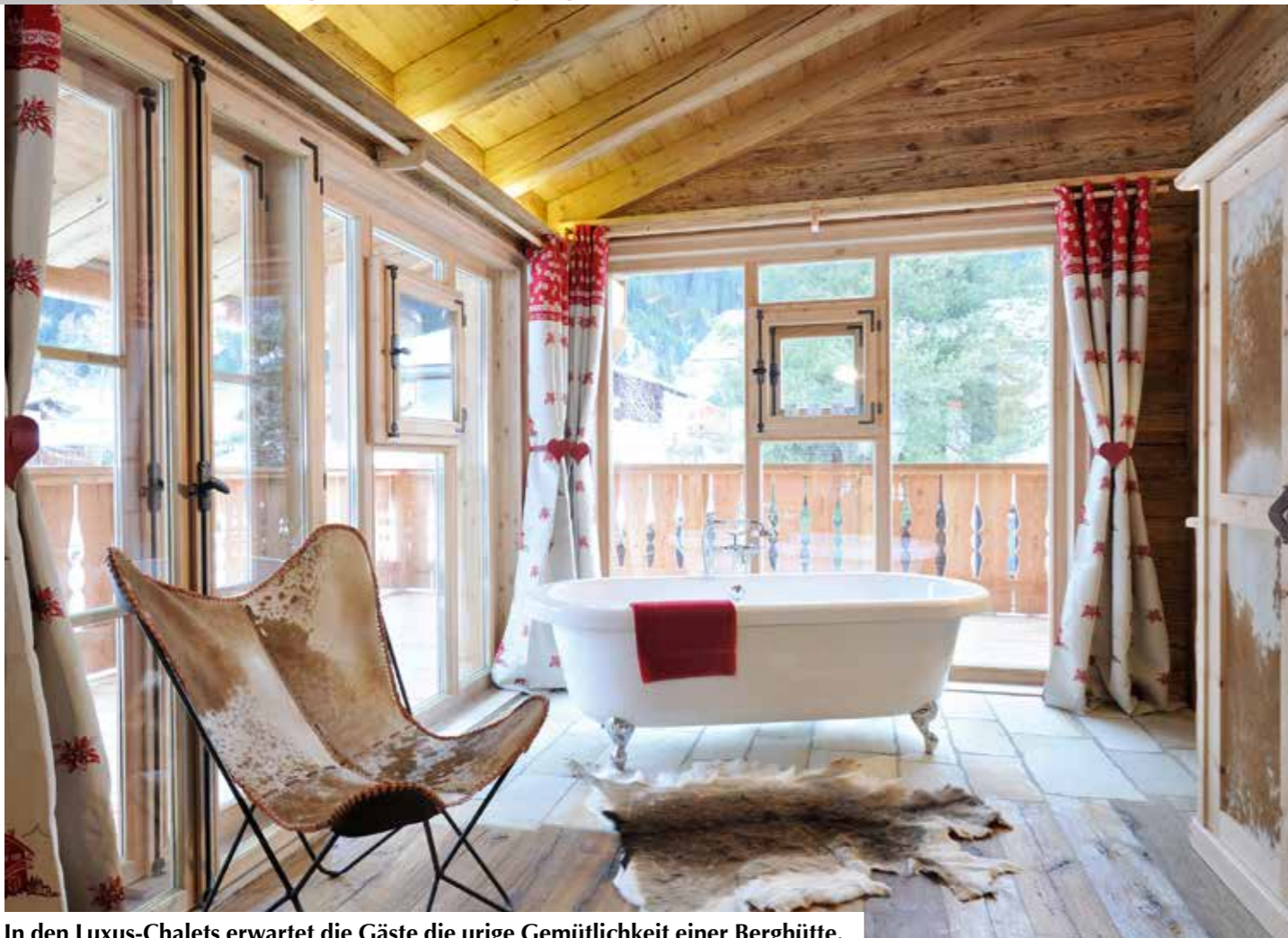
In den Luxus-Chalets erwartet die Gäste die urige Gemütlichkeit einer Berghütte.